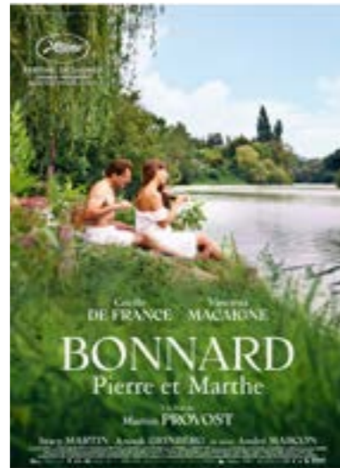
▶ dimanche 4 fév. à 15h30