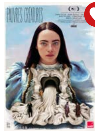
▶ mardi 20 fév. à 20h30