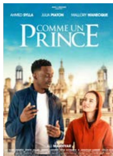
▶ dimanche 11 fév. à 16h