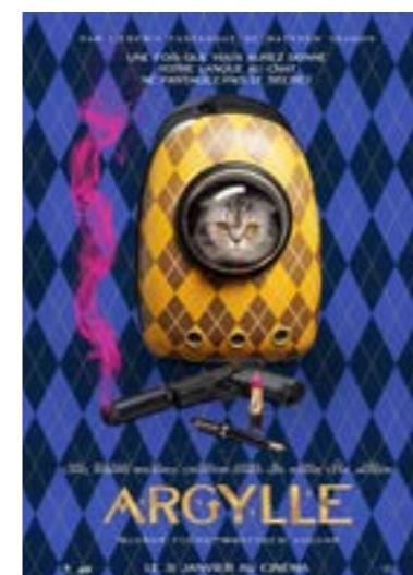
▶ mardi 27 fév. à 20h30