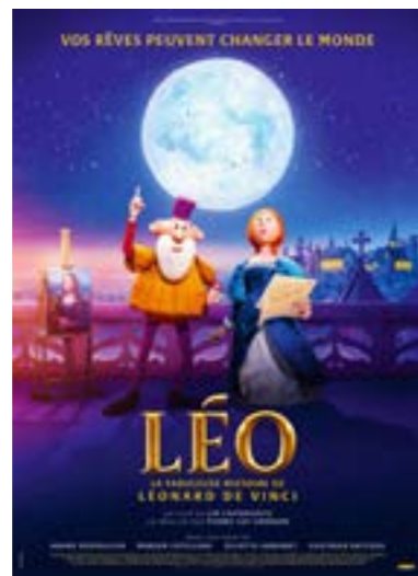
▶ dimanche 11 fév. à 14h