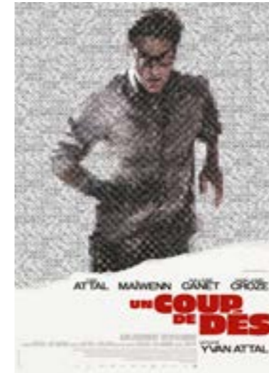
▶ dimanche 18 fév. à 16h