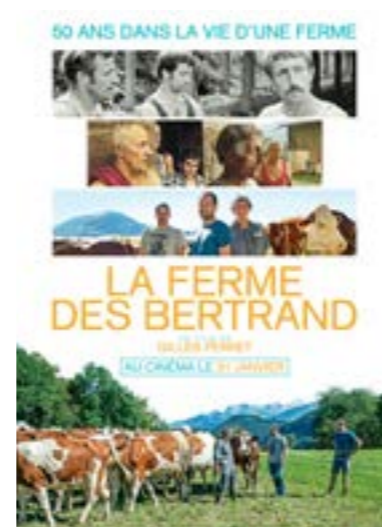
▶ dimanche 25 fév. à 16h