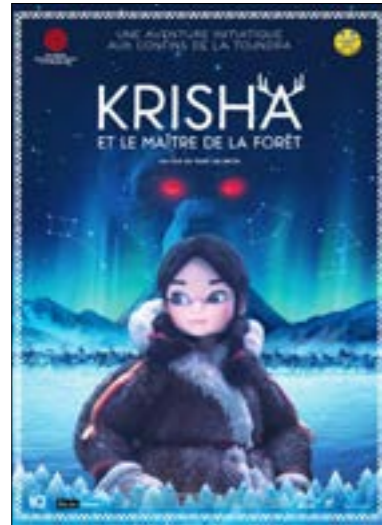
▶ dimanche 4 fév. à 14h