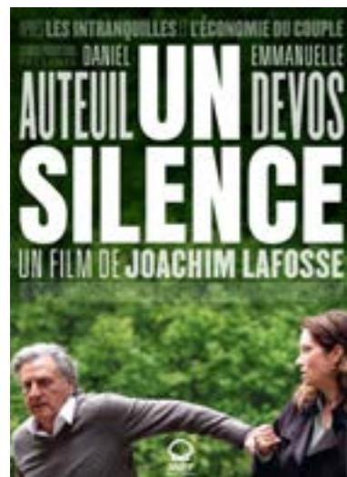
▶ mardi 6 fév. à 20h30