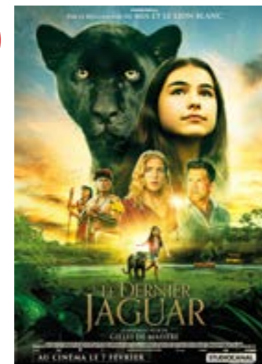
▶ dimanche 25 fév. à 14h