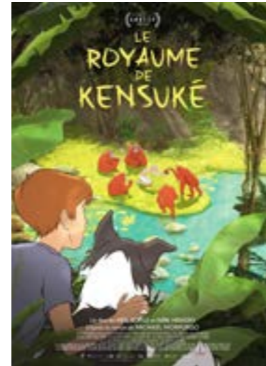
▶ dimanche 18 fév. à 14h