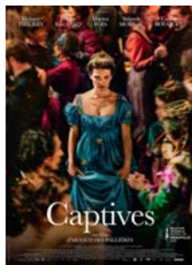
▶ mardi 13 fév. à 20h30