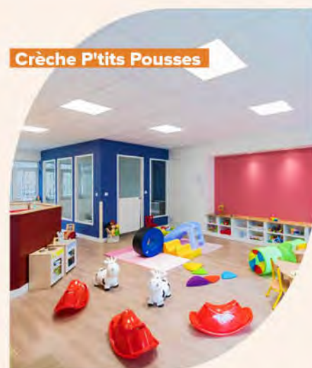
Crèche P'tits Pousses