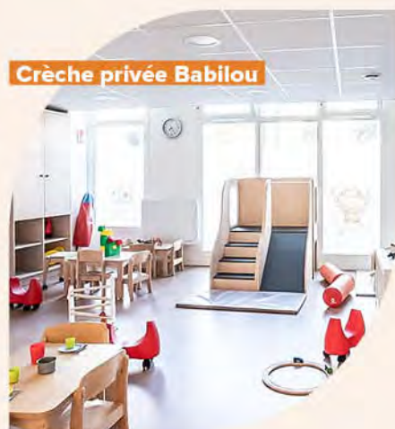
Crèche privée Babilou