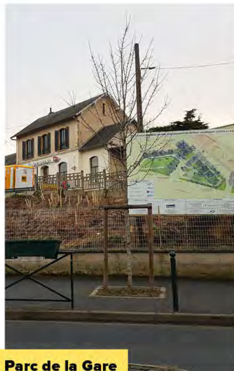
Parc de la Gare